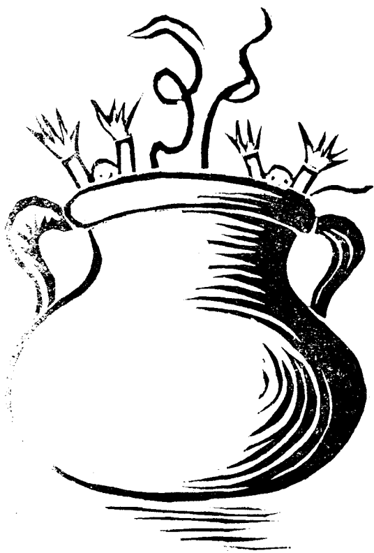
L'Assemblea que va celebrar l'Olot F. C. el 30 de Setembre prop-passat, vista pel nostre dibuixant «Apa-siau».

Ja passa de quinze dies que es va celebrar; com que fou interessantíssima, hem cregut donar-la a la llum com a entreteniment del tiberi esportiu de l'any.