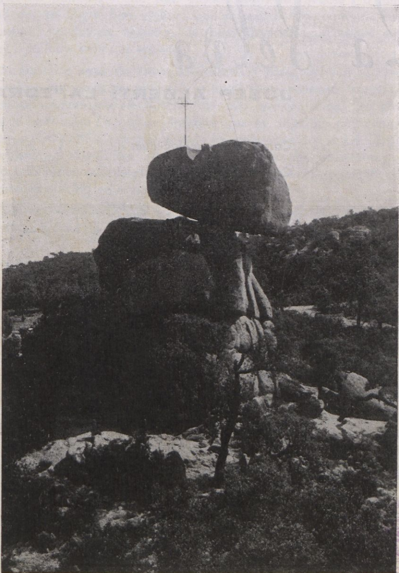
PEDRALTA. - Aquest curiós bloc granític, de forma basculant, es troba situat en la serralada litoral que mira a la Vall d'Aro, entre les poblacions de Solius i Sant Feliu de Guixols.