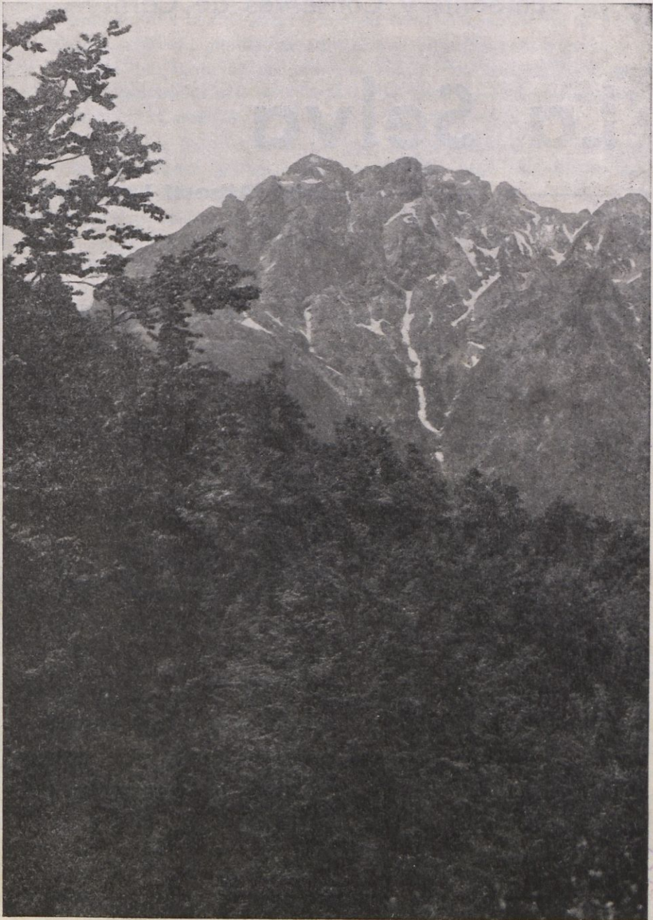
Pared nord del Pedraforca