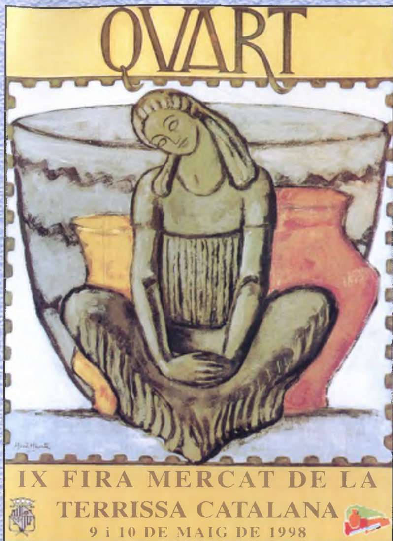
CARTELL 1998 "LA DAMA DE QUART"