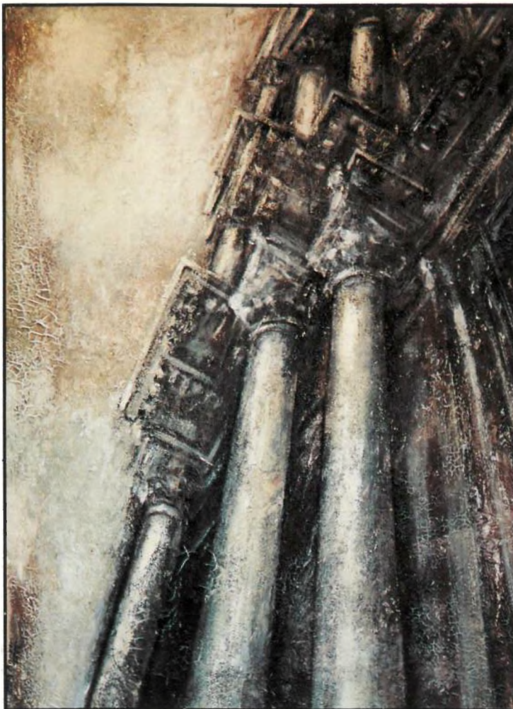
Façana Catedral Girona 89 x 115

Oh encís dels arcs romànics! ¿Qui diria que en la vostra penombra, tota amor, viu una secular filosofia incompactible com el sicomor?