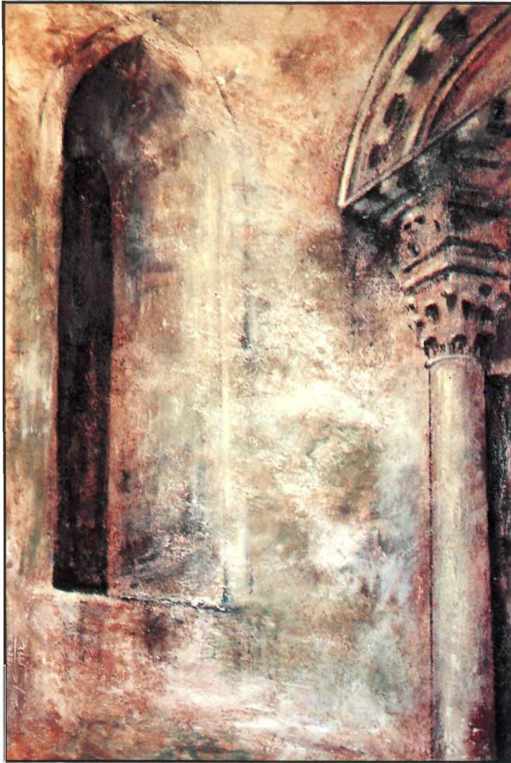
Finestra Sant Fèlix 81 x 115

"Del romànic al gòtic, quin encís! Transició perfecta en harmonia amb els carreus i els arcs on l'art floria per la virtut d'un eternal somrís".