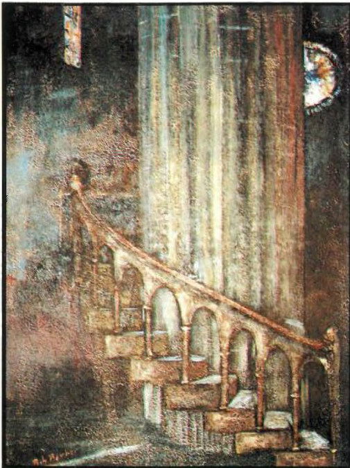
Interior Catedral Girona 110 x 130

"Dins la nau de la fàbrica sagrada el silenci és august. Han emmudit els versicles del bíblic rei David i, a l'ara, la Bondat hi és consagrada.