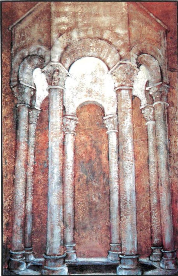
Banyes Àrabs 73 x 116

"El punt zenital filtra impureses de la claror del segle XII. El sol de migdia crema els deserts, a les terres dels àrabs. Però això és Girona, Mediterrània doncs, amiga del sol si la boira ho permet. Un sol casolà és convidat a entrar per dalt i descendeix al temple amb una irrepetible llum d'aquari".