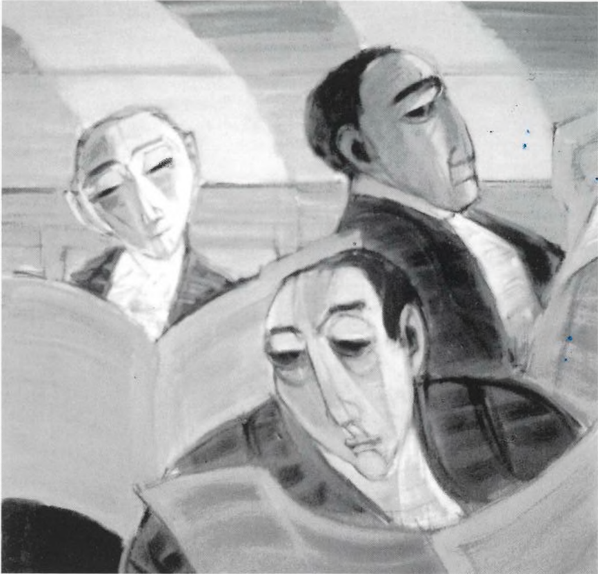
“LECTURA MATINAL”. Oli s/tela. 70 x 70 cm