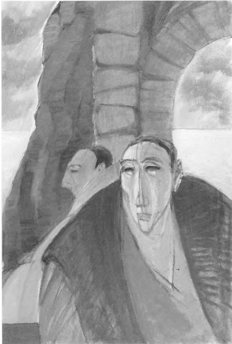
"L'ESPERA". Oli s/tela. 62 x 92 cm