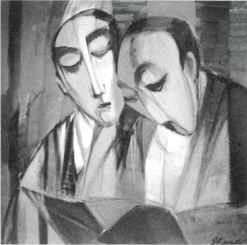
“DESXIFRAT”. Oli s/tela. 70 x 70 cm