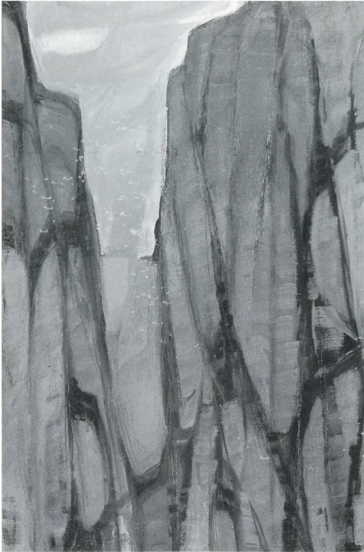
"FAL-LÀCIES". Oli s/tela. 81 x 54 cm