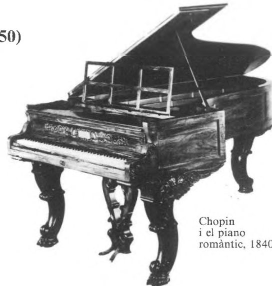
Chopin i el piano romàntic, 1840.

És a començament del segle XIX quan els fabricants es veuen obligats, per les exigències de la pròpia música, a interessar-se més pel mecanisme (expressió, atac).