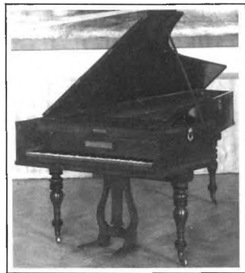
A l'època de Beethoven, 1810