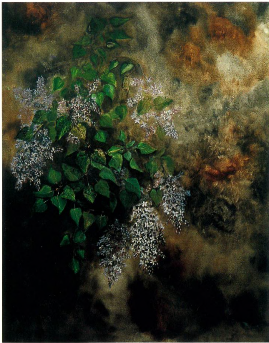
Pintura sobre tela 92 x 73