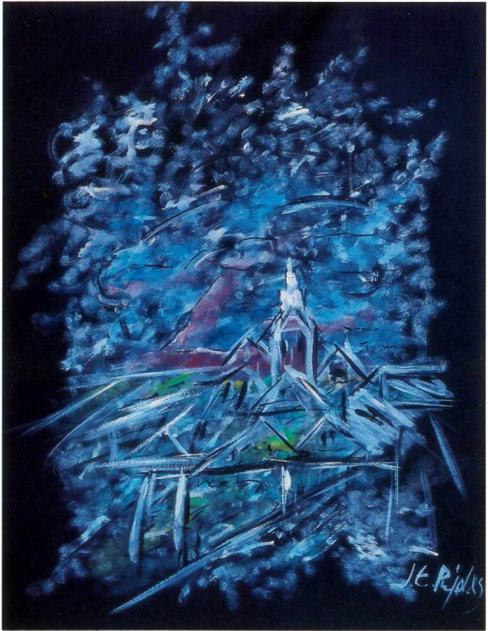
Oli sobre paper, 50 × 70