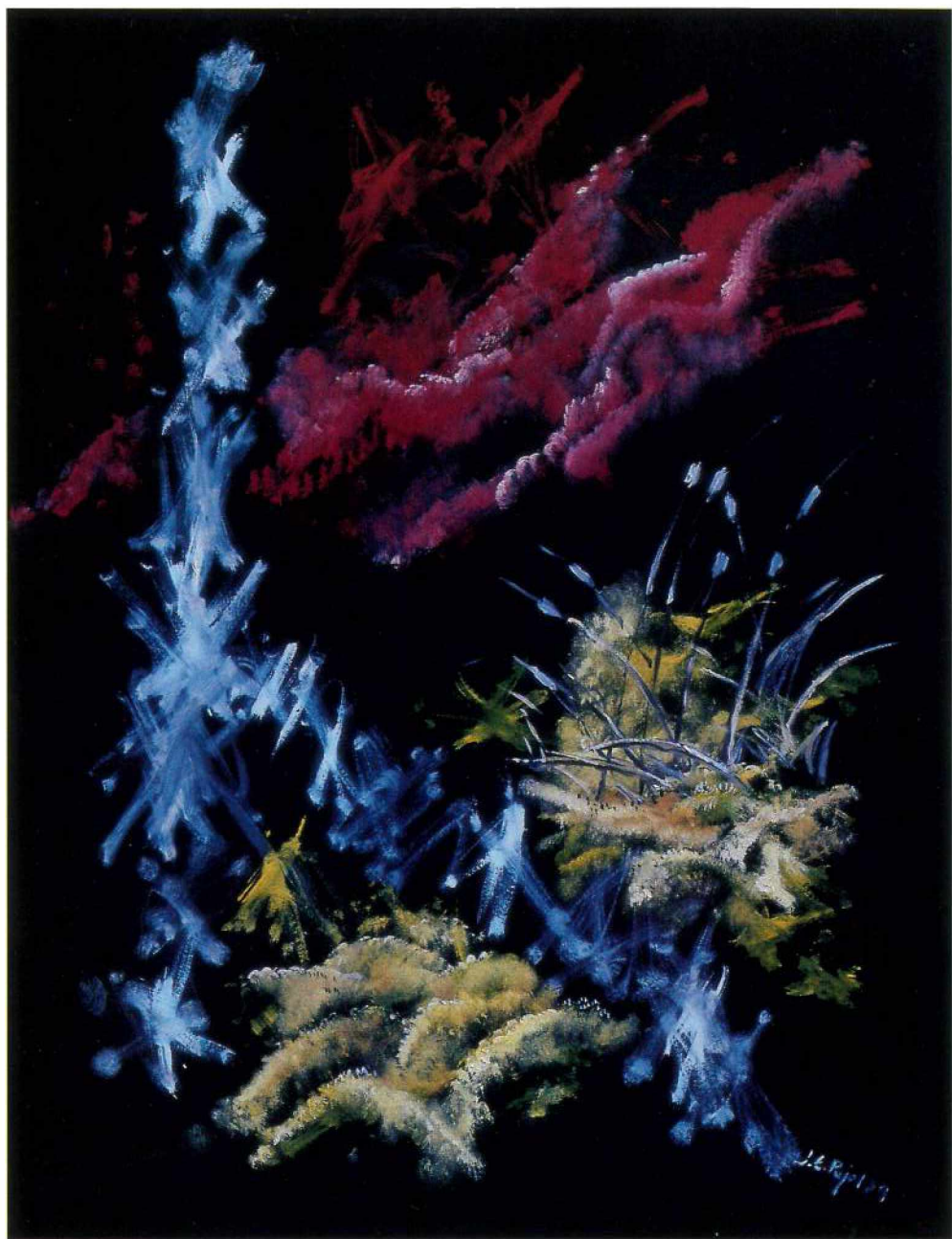
Oli sobre paper, 50 × 70