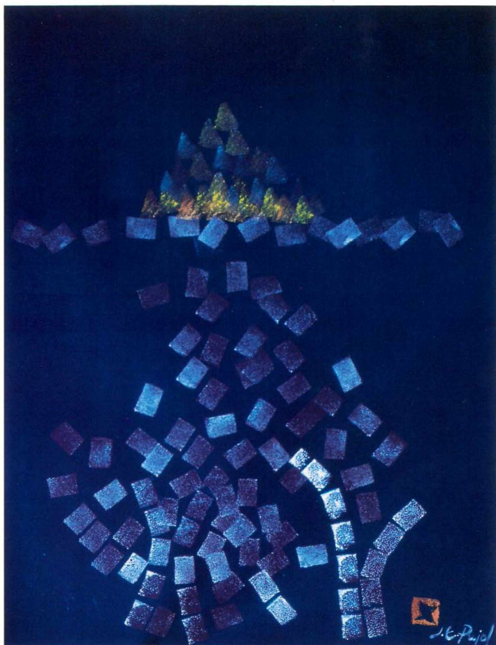
Oli sobre paper, 50 × 70