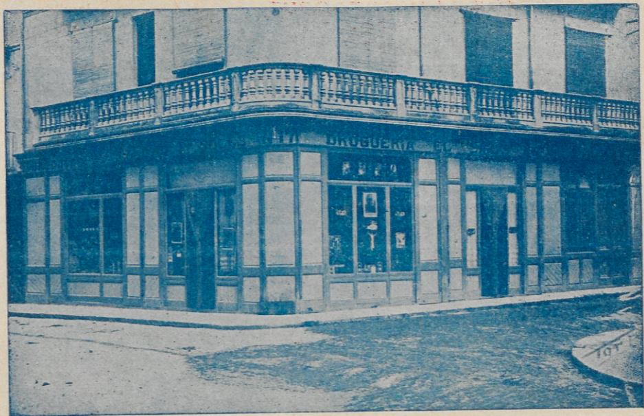
Droguería y Perfumería "EL SIGLO" : Figueras