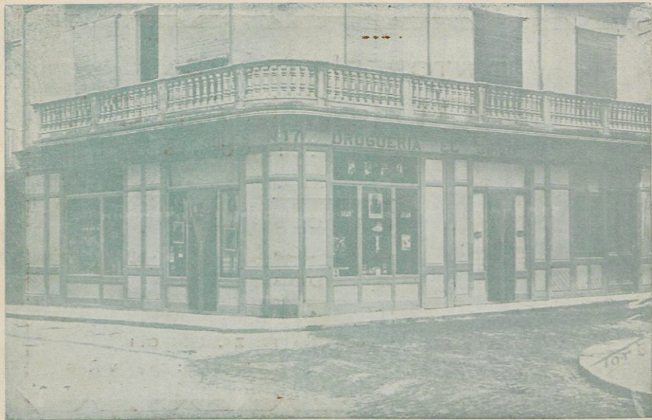
DROGUERIA Y PERFUMERIA «EL SIGLO» :: FIGUERAS