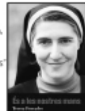
Es a les nostres mans Teresa Forcades

Presentació del llibre "Es a les nostres mans"