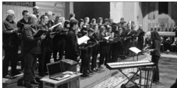
FOTO DE L'ACTUACIÓ DE LA CORAL CYPSELLA A OLOT

La setmana passada, per un error nostre, vam entregar per a la seva publicació una fotografia del concert del diumenge 19 d'octubre que no corresponia a l'actuació de la coral Cypsellà, era la de l'actua-