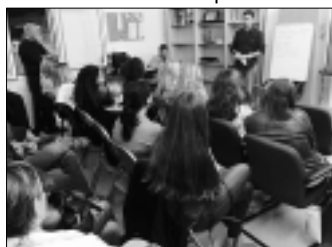
EF SANT FELIU