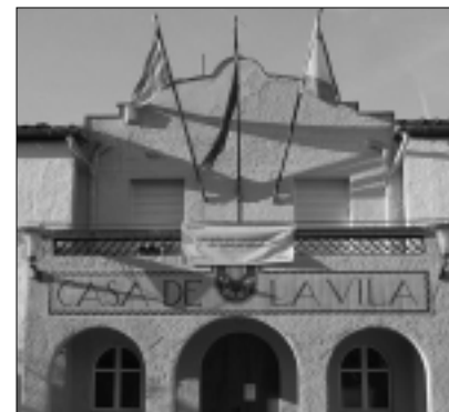
Les tres banderes onegen al balcó de l'Ajuntament vell.