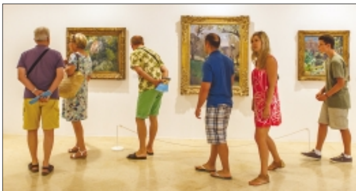
ESPAI CARMEN THYSSEN

Una part del públic de l'Espai Carmen Thyssen de Sant Feliu ha optat per veure en família l'exposició L'ideal en el paisatge. De Meifrèn a Matisse i Gontxarova. Col·lecció Carmen Thyssen . Les visites guiades familiars –que