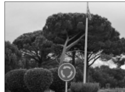
Santa Cristina tindrà 2 banderes espanyoles, la de la rotonda i la de l'Ajuntament.

Des de la setmana passada a la rotonda que dona accés a Roca de Malvet oneja una bandera espanyola.