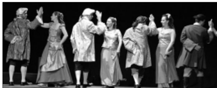
Una imatge de 1714, diari d'una esperança.

La segona activitat de la Promoció Teatre de tardor, emmarcada a la celebració del tricentenari, serà el dissabte 11 d'octubre a les 9 del vespre a l'Espai Ridaura amb Els Catalans. Taula rodona o la joia de ser catalans . Les forces vives de l'època es troben en un ateneu i debaten la decadència de la civilització occidental. Una sàtira divertida però tendra basada en una obra inacabada de Pere Calders. El preu de l'entrada és de 10 € i anticipada, 9 €, a l'Oficina de Turisme.