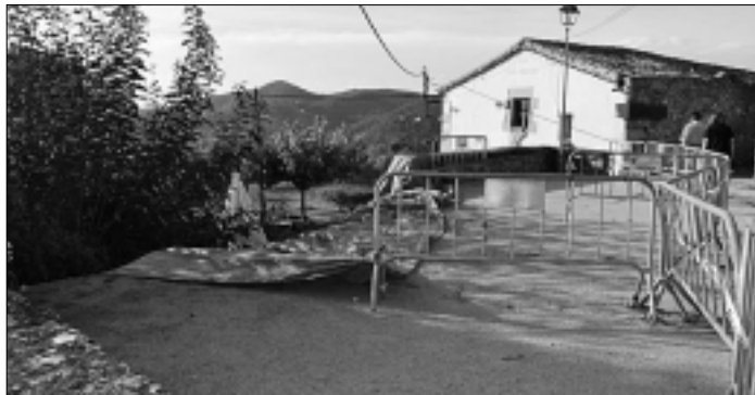
La paret va caure a la terrassa del restaurant can Roquet.

Sortosament ningú va prendre mal, el diumenge abans s'havia celebrat la Festa Major i és habitual que la gent s'assegui en aquesta paret.