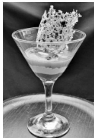
Millor Ganxotapa Primavera 2014: "Trifàssic Butron Berria"

aquesta primavera també s'ha comptat amb un rècord d'establiments participants, les 41 propostes presentades pels restaurants han tingut una gran rebuda, no tan sols entre els ganxons, sinó que un gran nombre de visitants han vingut a Sant Feliu per gaudir d'aquestes petites joies culinàries.