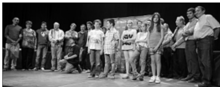
Foto de família dels guanyadors i del jurat.

Una quarantena d'establiments i empreses han fet possible el concurs, amb el suport de la Diputació de Girona i la Generalitat de Catalunya.