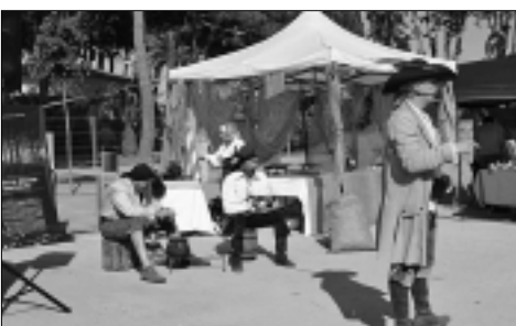
Les activitats van tenir molt bona acceptació per part del públic.