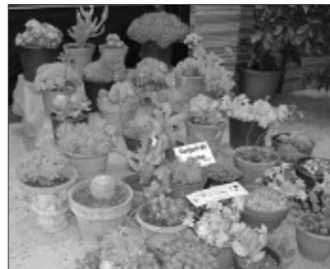
Les varietats més representades van ser la rosa individual, el cactus i la flor boscana.

premiés fins a 17 varietats diferents de plantes i flors. A cada varietat es va concedir un primer, un segon i un tercer premi. Aquest any, el guanyador del V concurs de fotografia amb motius florals va ser Carlos Casabona, que va rebre un sopar per a dues persones al restaurant Mas Torrellas. L'exposició va comptar amb la col·laboració de jardiniers professionals i dels alumnes de cicle inicial de l'escola Pedralta.