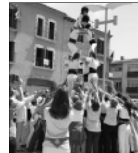
Imatge del castell 4 de 5 net.