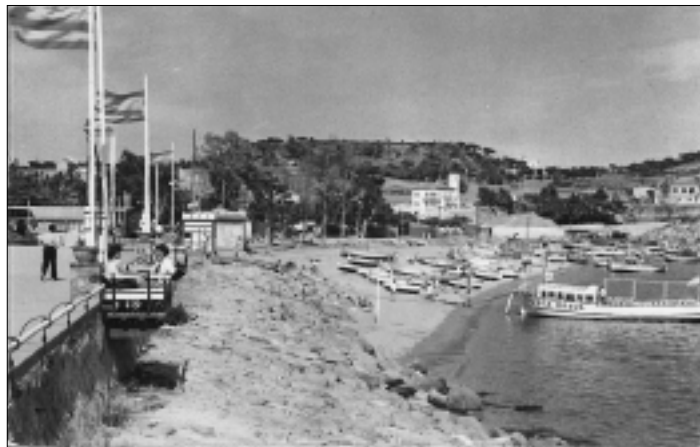
La barca Costa Brava avarada a la platja de Sant Feliu i les casetes de venda de tiquets a la barana de la platja a finals dels anys 50.

La imatge que des de finals dels anys 50 es podia veure durant els estius a la platja de Sant Feliu com era l'arribada dels "cruceiros" que cobrien la ruta turística per mar de la Costa Brava amb els corresponents passatgers embarcant i desembarcant, a partir d'aquest any 2014 ja serà història. Han estat