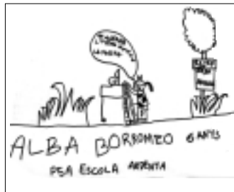
Dibuix d'ALBA BORRAMEO - 6 anys.

Ens veiem a la propera!!!! / NORA CASALS GARCIA - 6 anys.