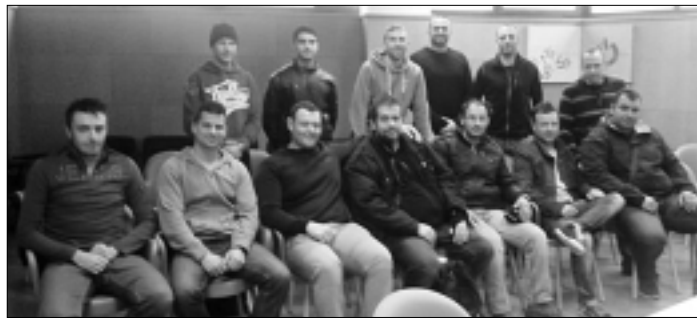
Imatge dels policies que van participar en el curs.

comptar amb la col·laboració de la Reserva Canina i el suport de l'ajuntament cristinenc.