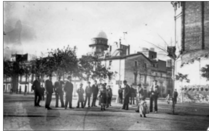
L'observatori Patxot al Passeig del Mar de Sant Feliu.