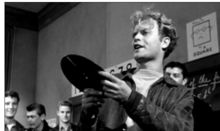
Imatge de Blackboard Jungle

rebelde que pudieran tener los adolescentes, contribuyendo de ese modo a una identidad y a un estilo que se fomentó hasta que, en los primeros años cincuenta, éstos se consideraban "una nueva generación". Esta autosugestión fue alentada por Hollywood, cuyos productores empezaron a adaptar sus películas cuando se dieron cuenta de que una buena parte del público era adolescente."