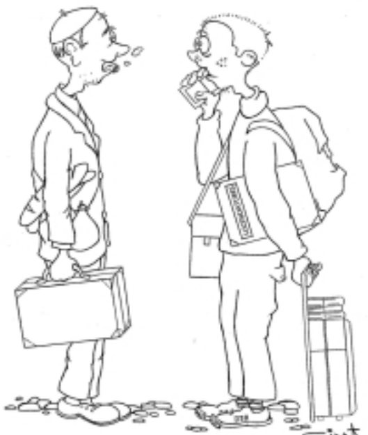
EMIGRANT DELS ANYS CINQUANTA.