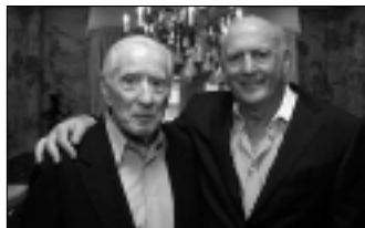
Leiber i Stoller.

-“Yo ya te lo dije (I tould you so)”: “Leiber & Stoller. La extraña pareja/ “(...) / Habían nacido [Jerry Leiber i Mike Stoller] en 1933 y se conocieron a finales de los años cuarenta en Los Angeles. Mike Stoller venía de un pueblo de Nueva York y deseaba componer música seria; Jerry Leiber había crecido en un barrio pobre de Baltimore, apreciaba la música negra y dominaba la jerga del gueto. Stoller leyó las letras que había escrito su amigo: no pudo evitar la risa ante aquellas historias disparatadas y se ofreció a ponerles música. Fueron aceptadas por artistas de rhythm & blues. La situación tenía gracia: dos adolescentes de origen judío componiendo para cantantes de color./ (...)”.