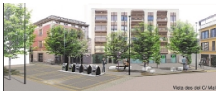
Vista des del C/ Mall

una part més elevada respecte dels carrers Sant Joan i Sant Pere, que es correspon amb un aparcament soterrani, amb problemes de filtracions d'aigua a través del paviment de la placeta, fet que el projecte preveu resoldre amb la formació d'una nova impermeabilització per sota del nou paviment. Així mateix, l'enderroc de l'actual estació transformadora i la modificació d'una part de la rasant de l'actual placeta –en concret en el tram d'unió amb la Rambla Vidal– permetrà que tota la plaça quedi al mateix nivell amb l'excepció del carrer Sant Joan i del carrer Hospital, en què hi haurà uns esgraons. D'aquesta manera es reduiran considerablement les actuals barreres arquitectòniques i es millorarà l'accessibilitat de la placeta. Pel que fa als paviments, al tram on transiten vehicles s'ajecarà el nivell i s'hi mantindrà el mateix tipus de llamborda, amb el mateix disseny que l'actual, i a la zona eminentment de vianants el