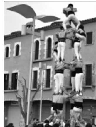
Moments abans de coronar un dels castells.