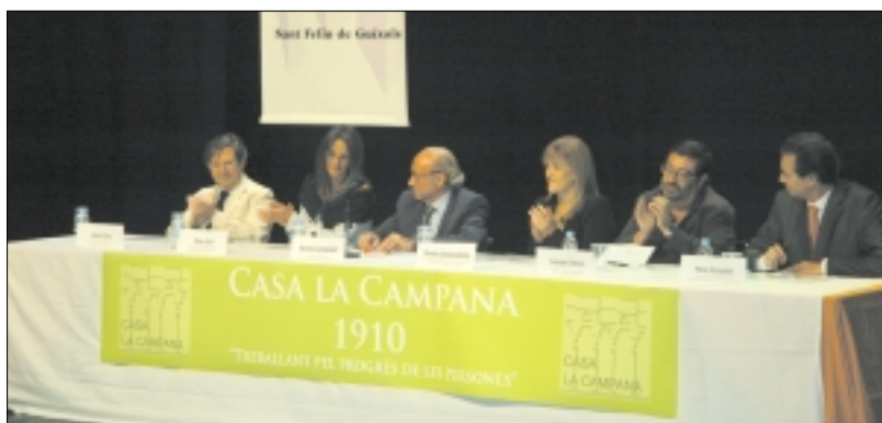
CASA LA CAMPANA