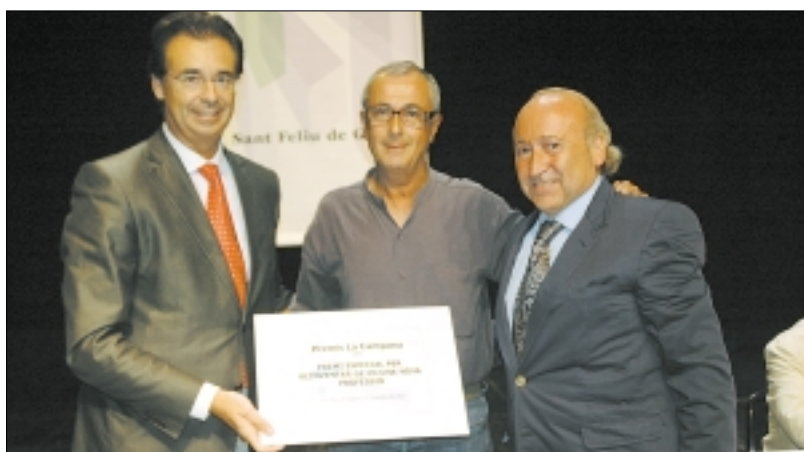
CASA LA CAMPANA

El Centre de Formació Casa la Campana de Sant Feliu de Guíxols, va atorgar els Microcrèdits a L'Emprenedor 2011, el passat dia 14 d'octubre en el Teatre-Auditori Municipal Narcís Masferrer de Sant Feliu de Guíxols.