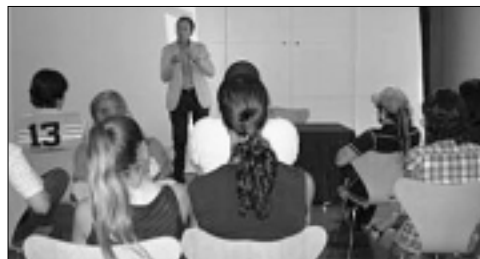
Imatge d'un instant de la xerrada.

La Caixa va fer públic els principals indicadors econòmics dels municipis amb més de 1.000 habitants. A Santa Cristina d'Aro al 2010 hi havia 5.067 habitants. Als últims 5 anys, el municipi ha augmentat en 1.084 persones, un 27'2%. D'entre el total