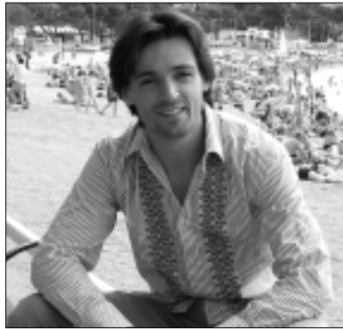
Àngel Corella a Sant Feliu.

Medalla d'Honor del Festival per a Àngel Corella