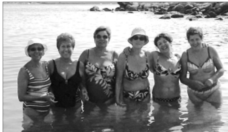
Últimes remullades d'estiu de la colla de les ganxones.