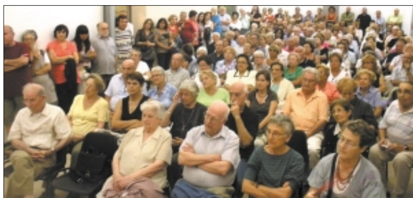
RÀDIO SANT FELIU