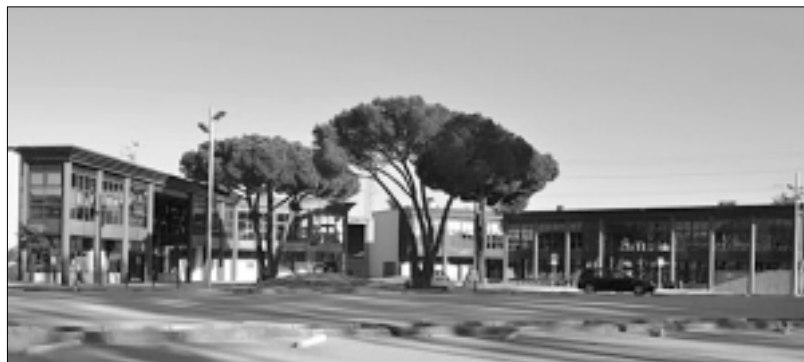
La remodelació de la plaça Catalunya ha conservat els pins.

Aquest projecte, redactat per l'Àrea d'Urbanisme de l'Ajuntament de Santa Cristina, ha ordenat una de les zones amb més aflluència d'usuaris del municipi ja que s'hi concentren la majoria de serveis públics del municipi, com el Centre d'Atenció Primària, Serveis Socials, el Centre de Dia Gent Gran, l'Ajuntament i la Policia Local. La remodelació ha conservat el paviment de terra tot i que se l'ha tractat químicament per no fer-se malbé en temps de pluges. En canvi s'han pavimentat les zones d'accessos directes als serveis públics, s'ha enllumenat la zona i s'ha ordenat la zona d'aparcament de cotxes i motos. L'aparcament de vehicles pesats s'ha traslladat a l'Espai Ridaura. També s'han habilitat 4 zones verdes on a 3 de les quals un grup de joves de la Casa d'Oficis les Gavarres 2010-11 hi ha plantat plantes autòctones.