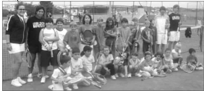
Grup d'entrenament dissabtes migdia.