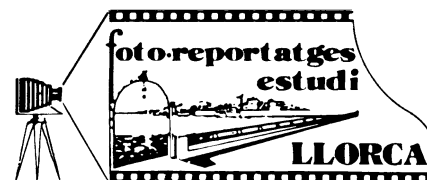
foto-reportatges estudi LLORCA Carrer Major, 16 Tel. 972 32 00 70 SANT FELIU DE GUÍXOLS fotollorca@hotmail.com FOTOCÒPIES B/N - COLOR FOTOS CARNET SERVEIS DIGITALS - LABORATORI COLOR VENDA MATERIAL

Avinguda Carrilet, 64 Tel. 972 82 29 69 - Fax 972 82 03 99 a/e: perlum@perlum.com www.perlum.com 17249 CASTELL D'ARO