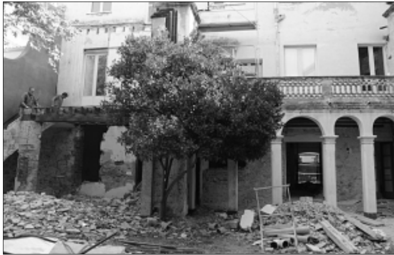
AJUNTAMENT - PRENSA

Ja han començat les obres de reforma de l'edifici de l'Escola Municipal de Música, que tindran una durada de vuit mesos i estan valorades en 417.942,97 €. Tot i que en el projecte inicial estava previst que la rehabilitació es dividís en dues fases, l'Ajuntament ha acordat amb l'empresa constructora que es faci simultàniament per minimitzar les incidències de les obres en el funcionament normal de l'escola, evitar trasllats i optimitzar recursos. Així, doncs, el que estava previst fer-se en dues etapes –durant cinc mesos l'estiu del 2011 i durant tres mesos l'estiu del 2012– estarà enllestit el febrer vinent. Per fer-ho possible, l'Ajuntament signarà un conveni amb l'empresa adjudicatària, Calam Tapias Construccions SL, que permetrà fer els pagaments de la segona fase l'any 2012. Així, l'empresa n'avançarà els costos, que els seran abonats l'any vinent sense cap sobre-cost per l'Ajuntament.