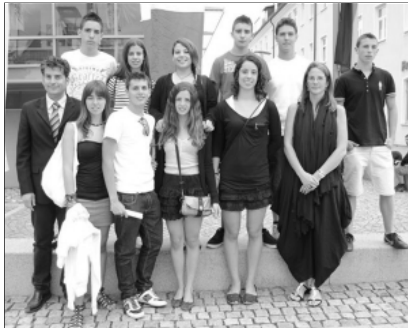
AJUNTAMENT - PREMSA

Però Sant Feliu de Guíxols va guanyar en altres camps. En les relacions públiques, els deu nois i noies van excel·lir. Es van guanyar tothom, i parlant de guanyar, van vèncer en alguna