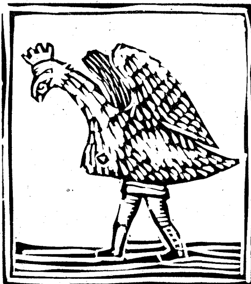
«L'Aliga» de Gerona Linoleum de Joaquín Pla

En Gerona presentáronse en el año 1.513 por primera vez para solemnizar aquella procesión tres figuras de tamaño descomunal e imponente: Lo Jagant (Gegant), Lo Drac y l'Aliga . El gigante llegó solo a la inmortal ciudad, esto es, sin compañera y en tan malas condiciones en cuanto a su resistencia, que cinco años después pasaba a mejor vida a pesar del pomposo título de « Statuam Magnifici Domini Gigantis de genere Nobilium Imperatorum » con que se le nombrara en algunos documentos de la época. Así, pues, en 7 de Mayo de 1.518 libróse el contrato de adquisición de un compañero de aquel noble personaje, que se construyó aprovechando los restos de su difunto antecesor. Es curioso observar que el Gigante o Jagant se mantuvo soltero hasta el año 1.593 en que fué contratada la construcción de su imperial consorte La Jagantesa , habiendo hecho anteriormente las veces de tal un hombre con vestimenta de mujer.(1)