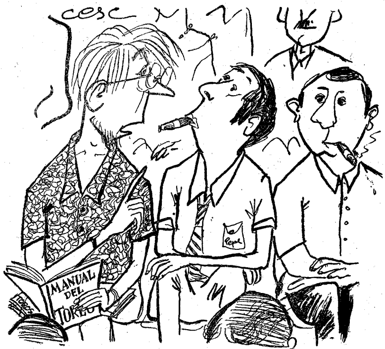
(Del Diario de Barcelona) —¡Uzteg ze ekivoca: Ezto no habg sido una Manole-tina, ezto habeg sido un Natugall!