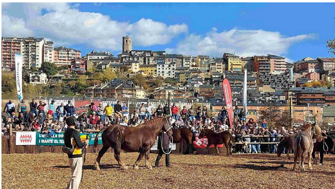
photo_cameraEl Concurs de Cavalls de Puigcerdà, que enguany arriba a la seva 43a edició, s'ha celebrat aquest dissabte / Feliu Sirvent

Els visitants poden gaudir durant el cap de setmana d'una espectacular exposició de bestiar en la que els criadors mostren els seus millors exemplars.