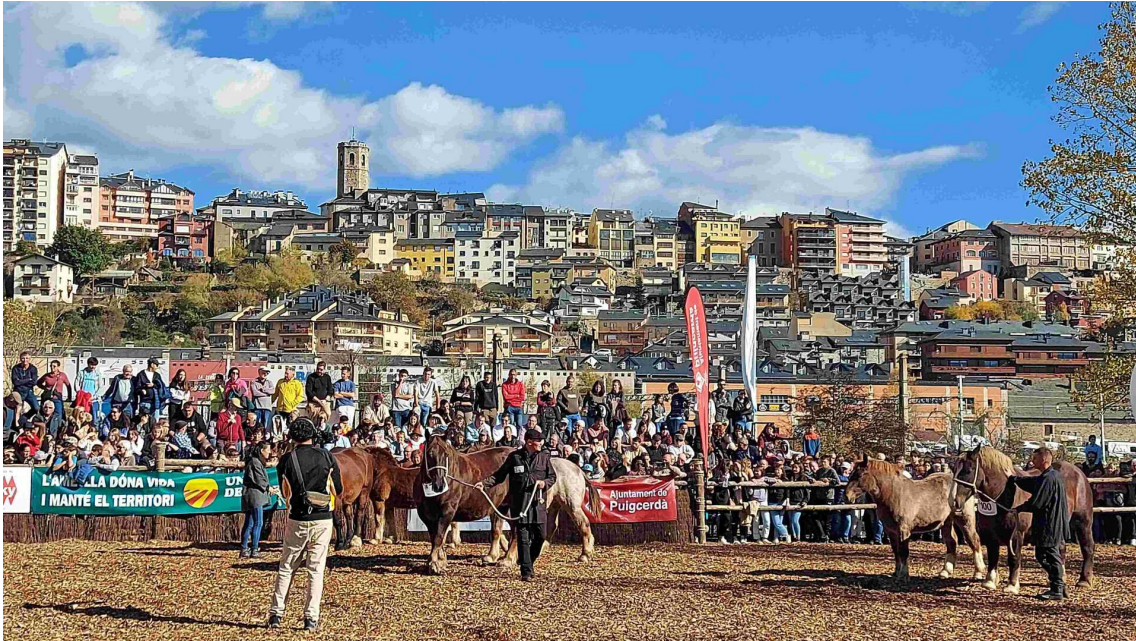
La 43a edició del Concurs de Cavalls de Puigcerdà s'ha celebrat aquest matí de dissabte

Actualment, la Fira del Cavall de Puigcerdà continua sent la mostra de bestiar equí més important del país , amb unes considerables xifres tant d'exemplars com de visitants, contractes de compravenda i permisos de transport per als animals venuts a compradors de fora de Catalunya. Aquí els visitants poden gaudir d'una espectacular exposició de bestiar en la que els criadors de la comarca (i també d'arreu del país) ens apropen les races autòctones i ens mostren els seus millors exemplars .