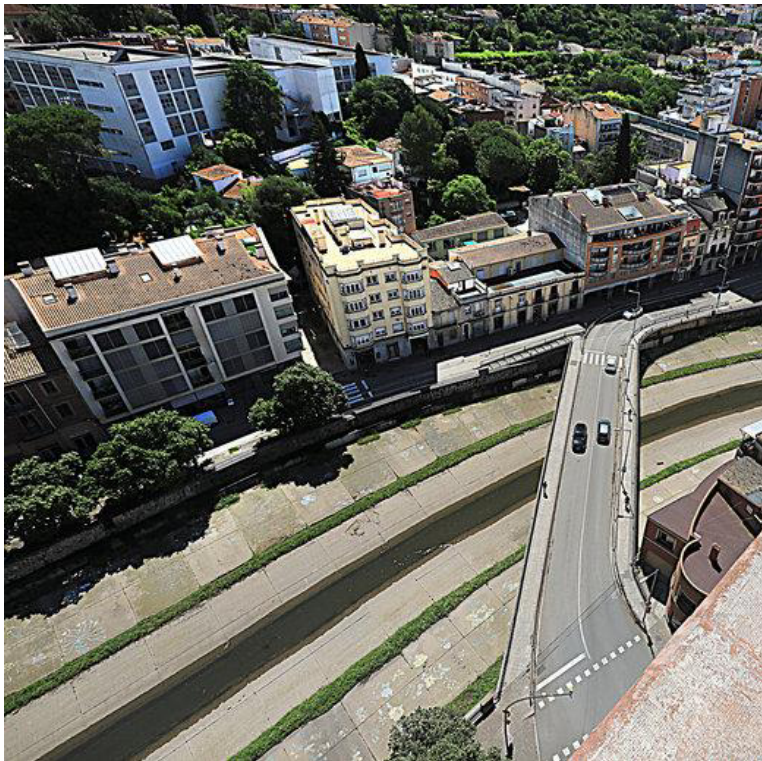
El riu Onyar, en el lloc on passa per sota del pont de l'A LLADÓ.