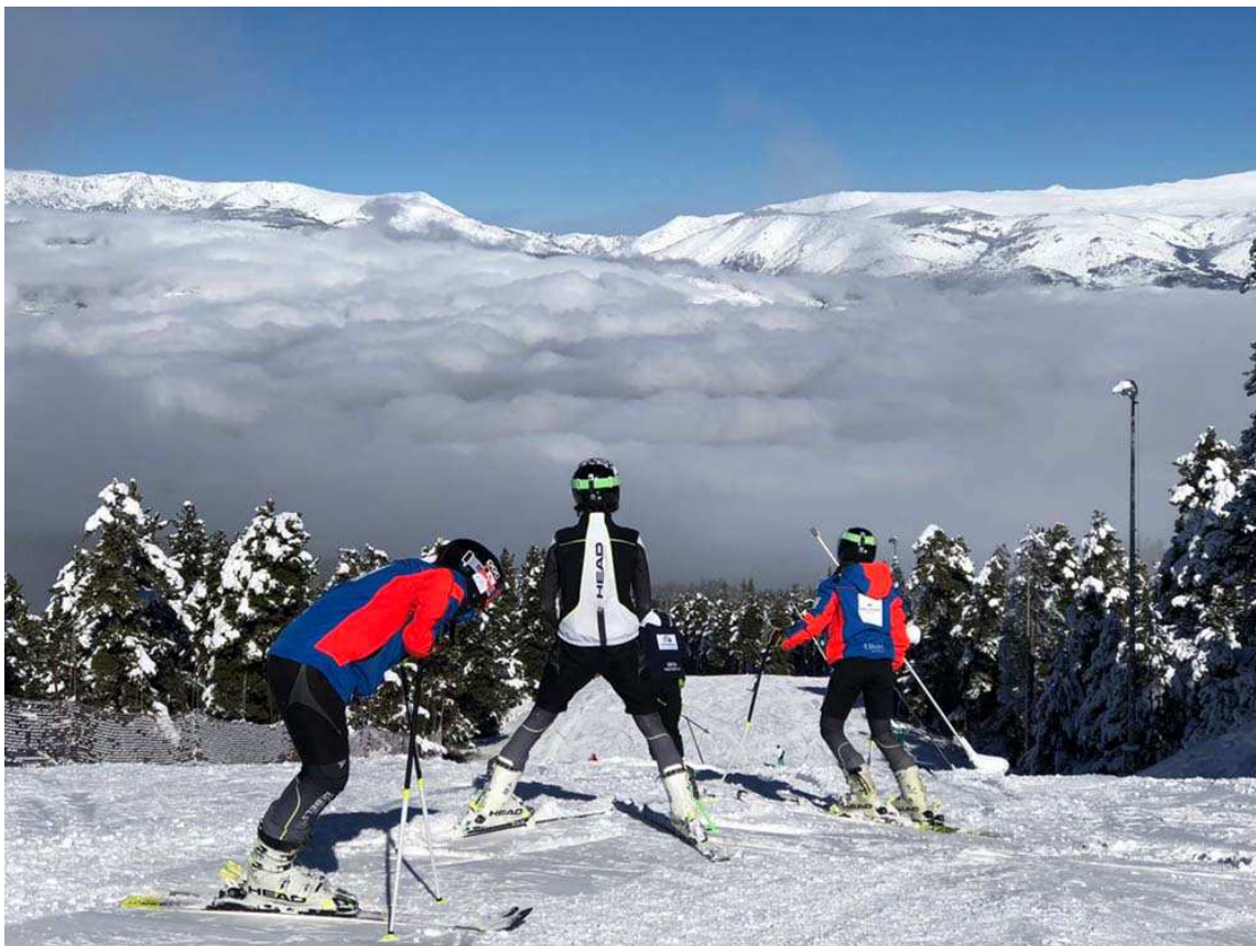
Pista Enamorats, l'1 de novembre de 2018.