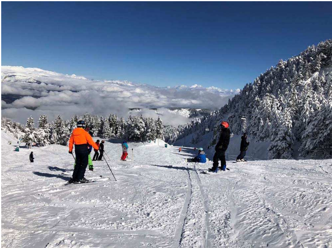
Cap a La Cova o cap a La Central? 1 de novembre de 2018 (Foto: IST).