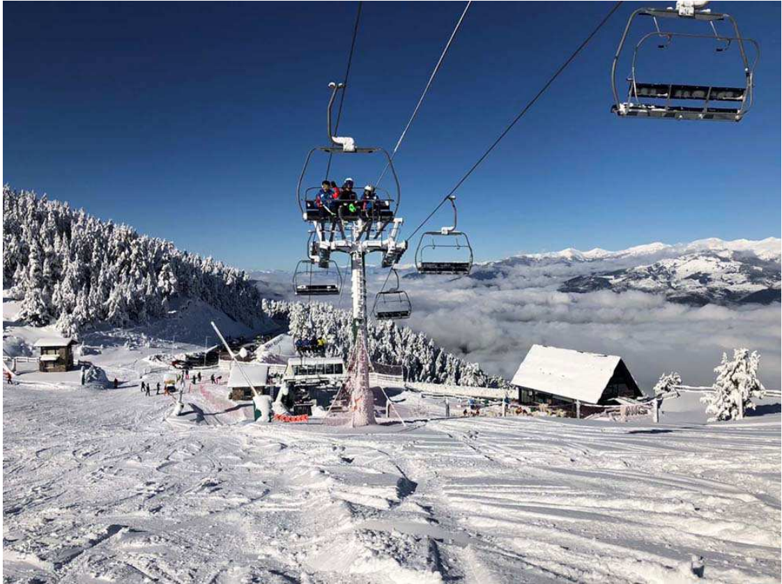
Telecadira Coma Oriola, l'1 de novembre de 2018 (Foto: IST).