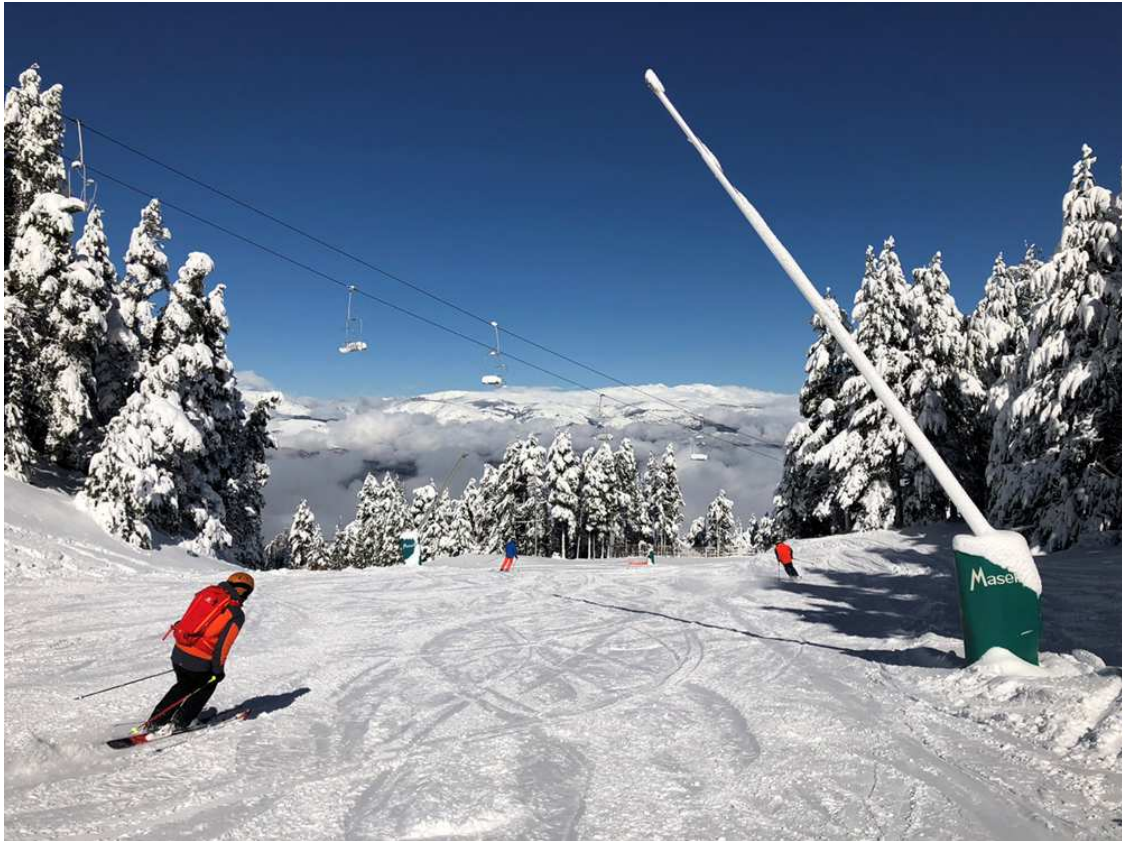
L'1 de novembre de 2018 a Masella: un dia de neu pòls, sol brillant, cel blau intens, vent en calma i paisatges de postal.