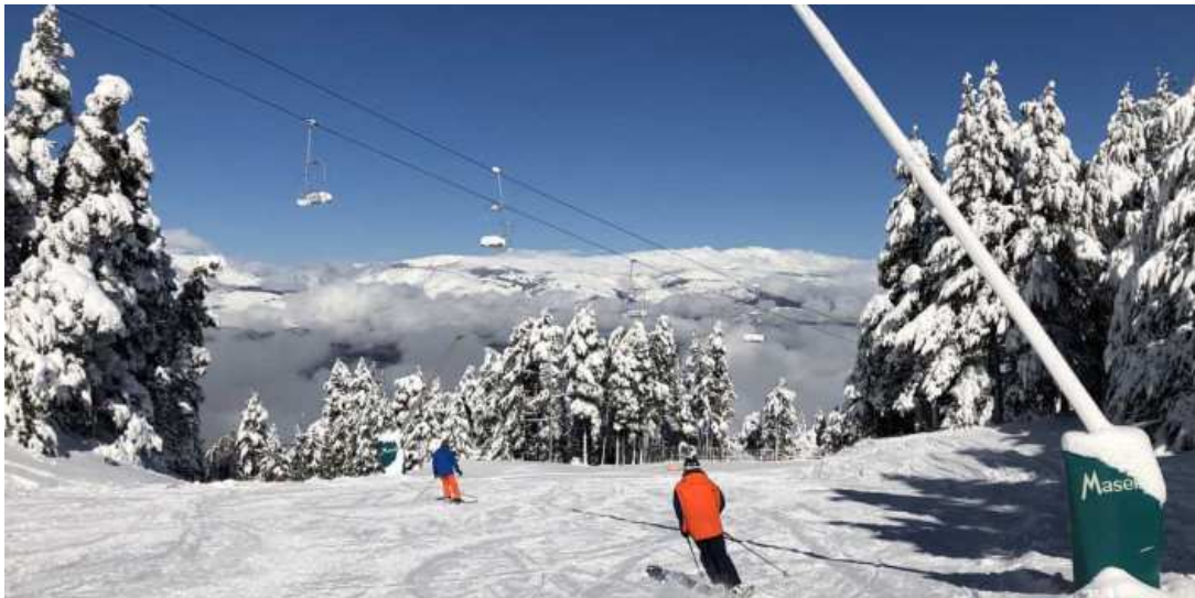
Efemèrides. Només fa 6 anys d'aquestes imatges

Recull d'imatges d'un històric 1 de novembre de 2018