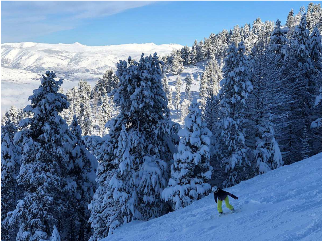
L'Estadi de Masella, l'1 de novembre de 2018.