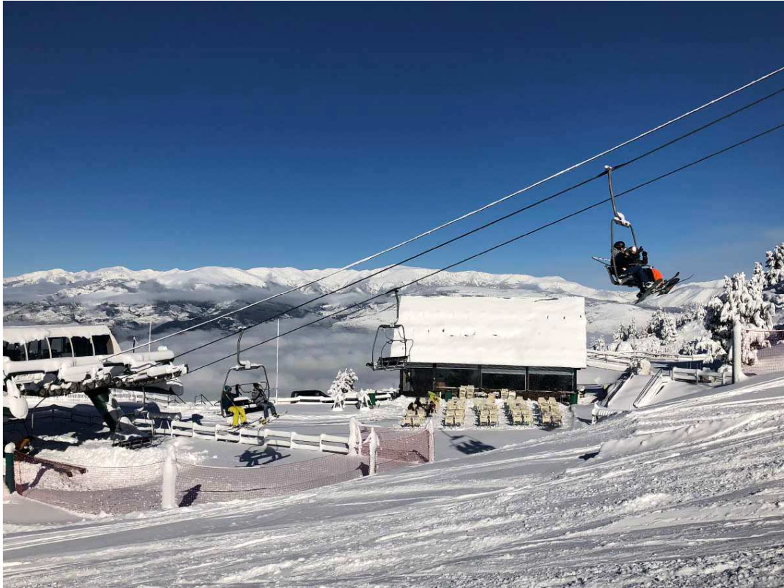
Així llúia Coma Oriola l'1 de novembre de 2018.

L'1 de novembre de 2018 va ser un dia històric per al segle XXI al Pirineu: una estació d'esquí del Pirineu oriental obria portes. Fa sis anys l'estació cerdana va aconseguir obrir 16 quilòmetres de pistes entremig d'un paisatge més propi de postal de Nadal que no pas d'un dia de tardor. L'endemà, el 2 de novembre, Masella ja publicava un comunicat de neu amb 34 quilòmetres esquiables.