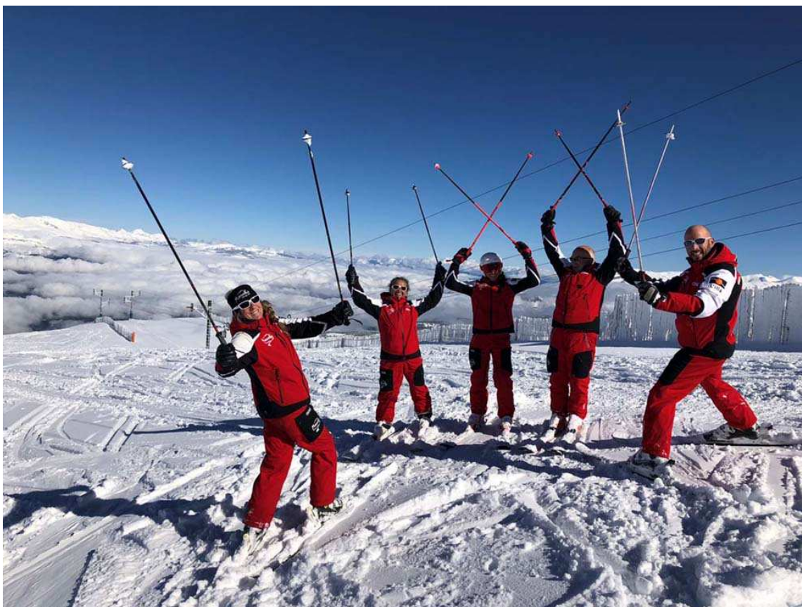
Un dia de molta alegria a la pista Tosa Vermella, l'1 de novembre de 2018.