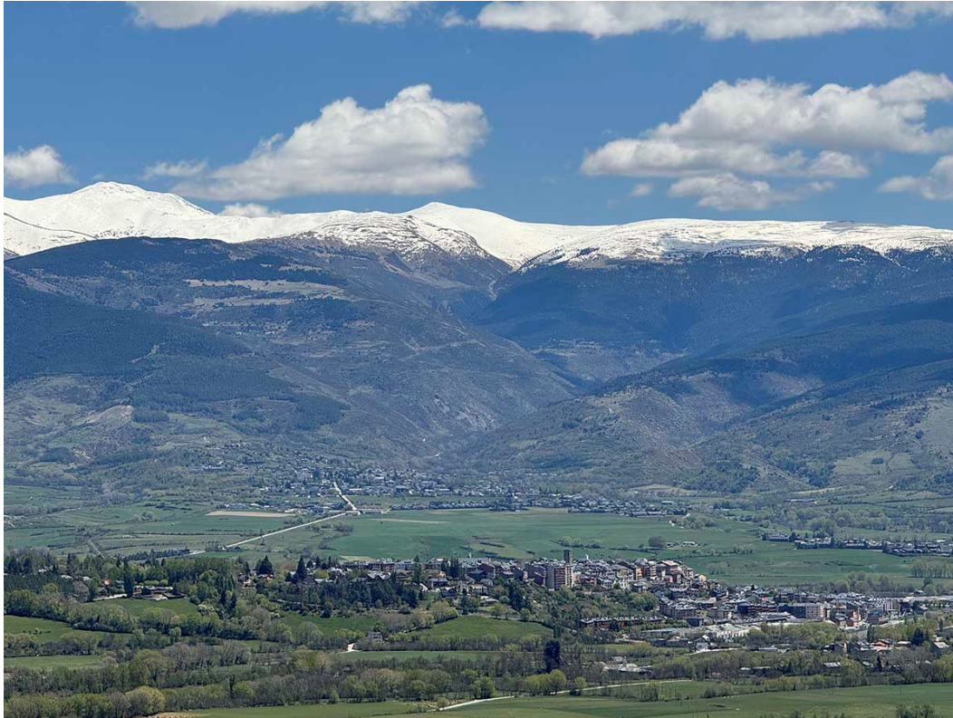
Congrés Euromontana 2024 o buscar solucions per gestionar la muntanya.

El XIII congrés biennal d'Euromontana , l'associació europea multisectorial de les àrees de muntanya, que tindrà lloc del 15 al 18 d'octubre a Puigcerdà, compta amb més de 250 inscrits en representació de diferents governs i de les principals associacions, organitzacions agràries i ramaderes, membres de la societat civil i d'ONG, així com instituts de recerca d'aquests territoris. Per aquesta cita ceretana, el programa del Congrés se centrarà en posar en comú solucions pràctiques i estratègies per incrementar la resiliència, sostenibilitat i prosperitat de les economies de muntanya.