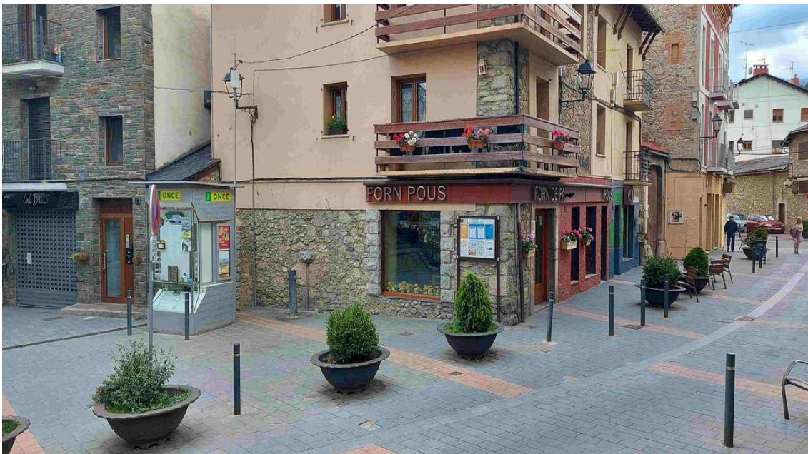
photo_cameraPlaça del Portal de Bellver de Cerdanya / Feliu Sirvent

La resolució del govern d'Espanya es publicarà al BOE d'avui després d'acordar-se amb la Generalitat