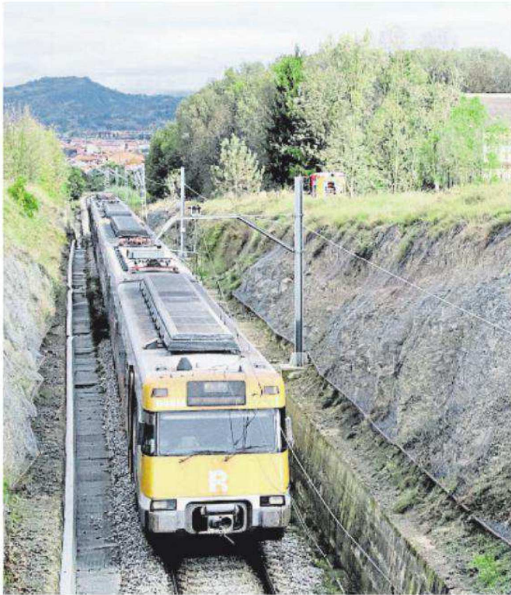
A l'esquerra, el tren parat entre Manlleu i Torelló; a la dreta, passatgers abandonant el comboi

El foc originat al pantògraf es va traslladar a dins d'un vagó