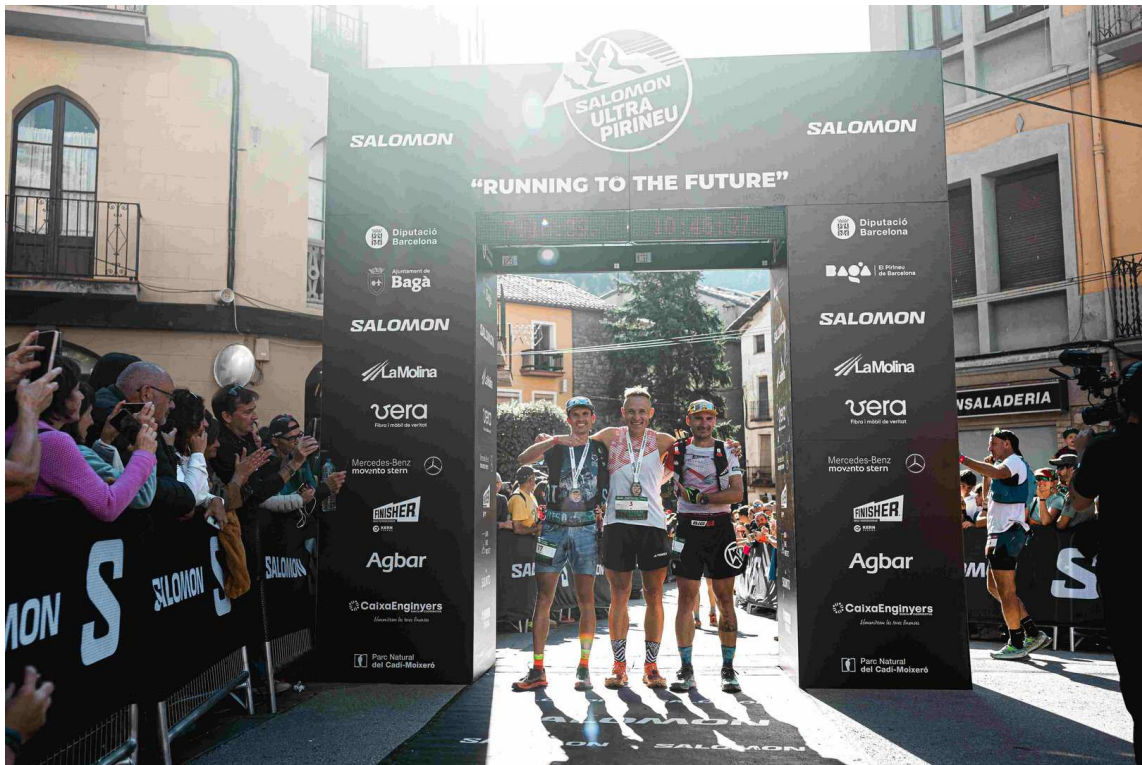
Podi Masculí Salomon Ultra Pirineu 2024.

intensos i emocionants del cap de setmana donant inici a la 15 a edició de la prova.