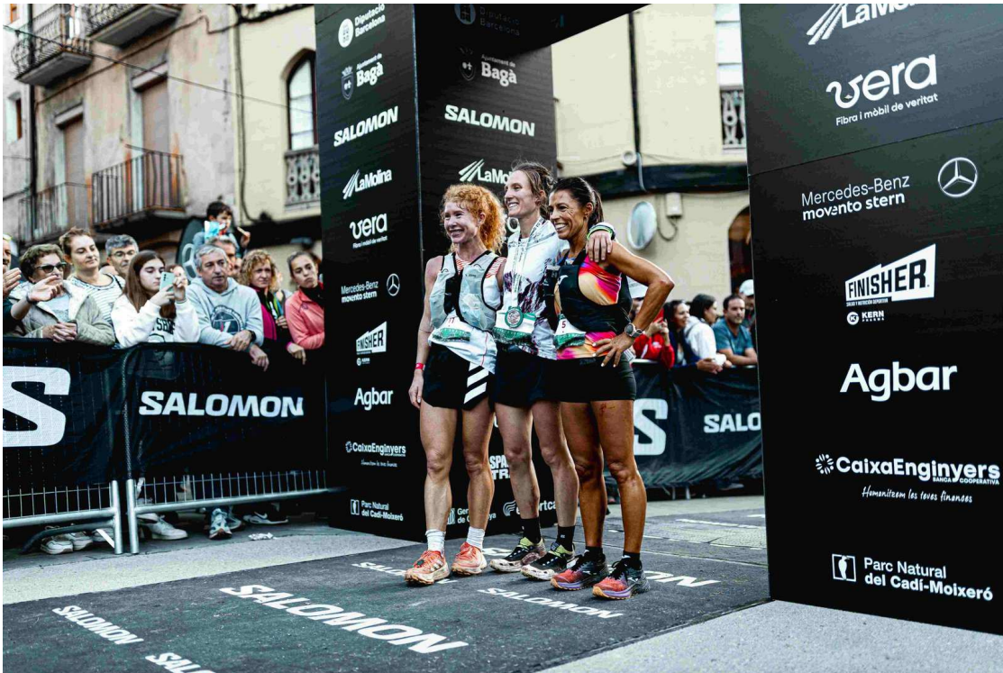
Podi Femení Salomon Ultra Pirineu 2024.

A partir del pas per Estasen, Arenas no ha pogut seguir amb el ritme imposat i ha vist com l'espai obert anava minvant a favor de Roux i Mityaeva qui ho han aprofitat en els últims quilòmetres adelantant a l'espanyola en seu pas per Sant Jordi i en l'última baixada a Bagà respectivament.