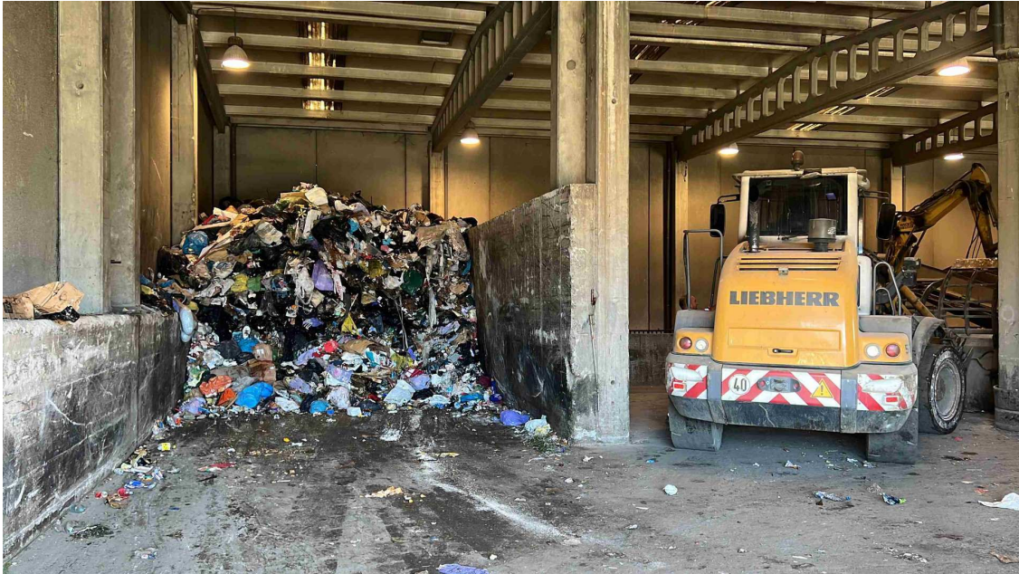
Gestió de residus a la planta de tractament de Cortàs, a Bellver de Cerdanya