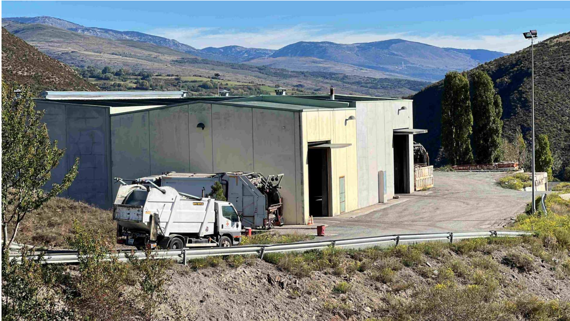
Un camió d'escombraries arribant a la planta de tractament de residus de Cortàs, a Bellver de Cerdanya

Mentre, Chia ha explicat que, a grans trets, el sistema de recollida porta a porta s'implantarà als nuclis de població més grans i que les illes de contenidors intel·ligents, amb un sistema de control d'obertura de les fraccions d'orgànica i resta, estaran en urbanitzacions o en zones on hi ha gent que no hi viu durant tot l'any. També ha dit que la nova empresa que executarà el servei de recollida de residus anirà aplicant els canvis de gestió de forma progressiva. El contracte serà de sis anys, prorrogable a dos més, per un preu que superarà els 16 milions d'euros.