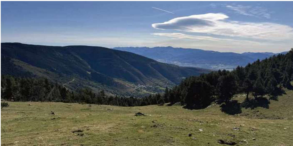
Estació d'esquí a Meranges, les primeres referències i especulacions Autor/a: Diaridelaneu

Un projecte que es va gestar a finals dels anys setanta i darrere el qual hi havia inversors holandesos