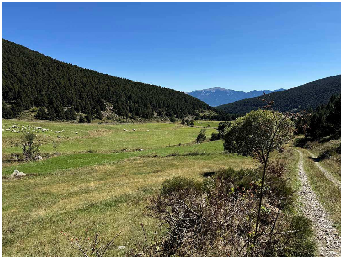
Zona de Campllong, a 1750 m, espai destinat a acollir una urbanització per a allotjaments i equipaments esportius (Foto: IST).

Entre els serveis hi havia previstos els bàsics, com ara restaurants, oficines, escoles d'esquí, tallers i magatzems. I atenció: una urbanització amb capacitat per a 1.000 "camas" que inclouria diversos equipaments esportius, com ara camp de golf o piscina, entre altres.