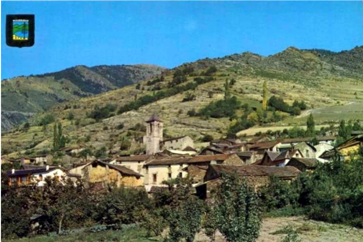
Meranges l'any 1969, en una postal d'Escudo de Oro.

També destacaven que, des de l'Ajuntament de Meranges, es va demanar el fet de poder comptar amb algun tipus d'ajut o assessorament per part de la Generalitat de Catalunya, que no feia massa anys que estava constituïda. Dit i fet, es va enviar una carta amb aquesta petició a la Conselleria d'Ordenació del Territori, i la qual va donar algun bon resultat un parell d'anys més endavant.