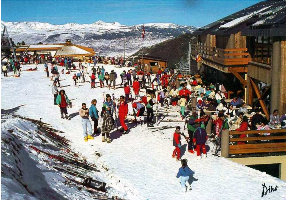
Puigmal als anys setanta, la darrera estació en obrir-se a l'Alta Cerdanya (Foto. editorial Dino).