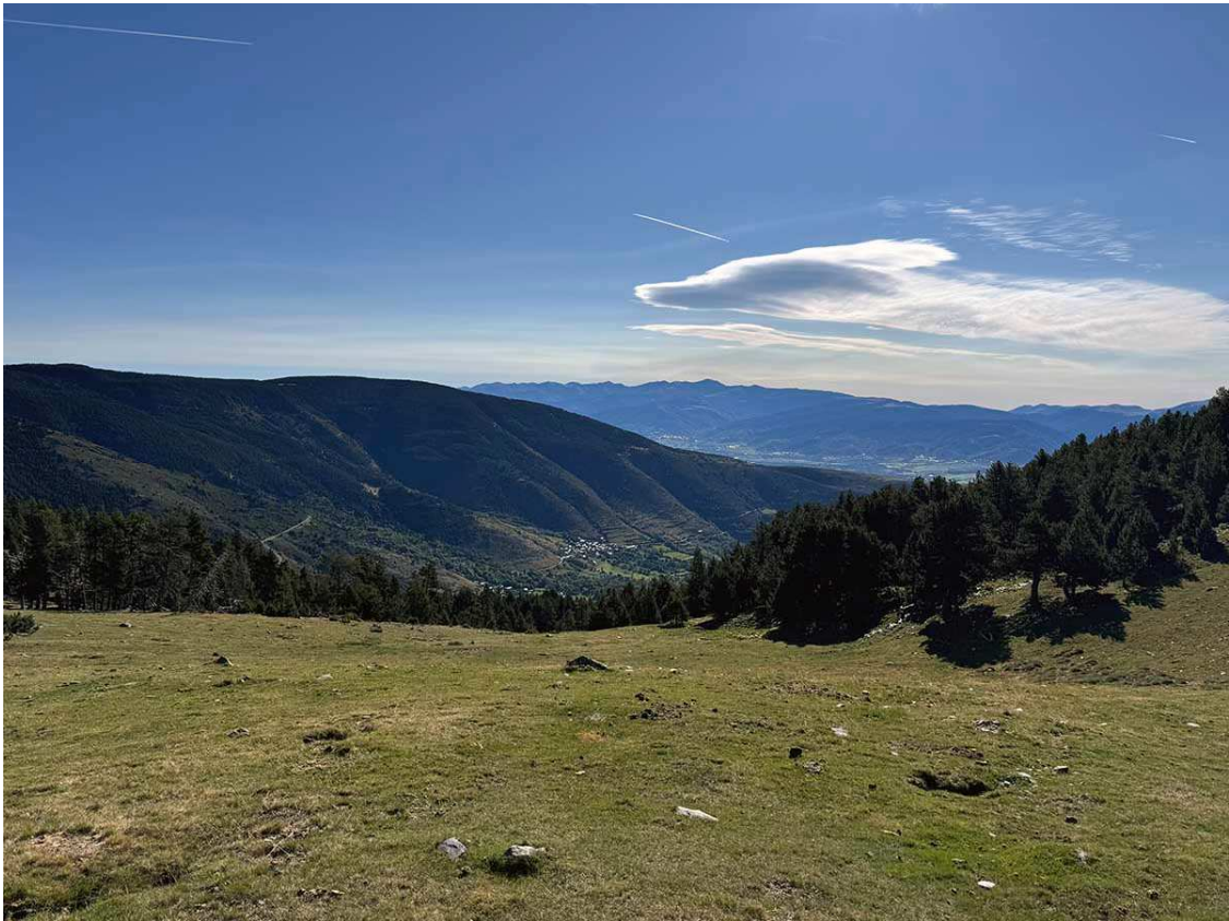
Zona de prats de pendent suau de Font berenella.