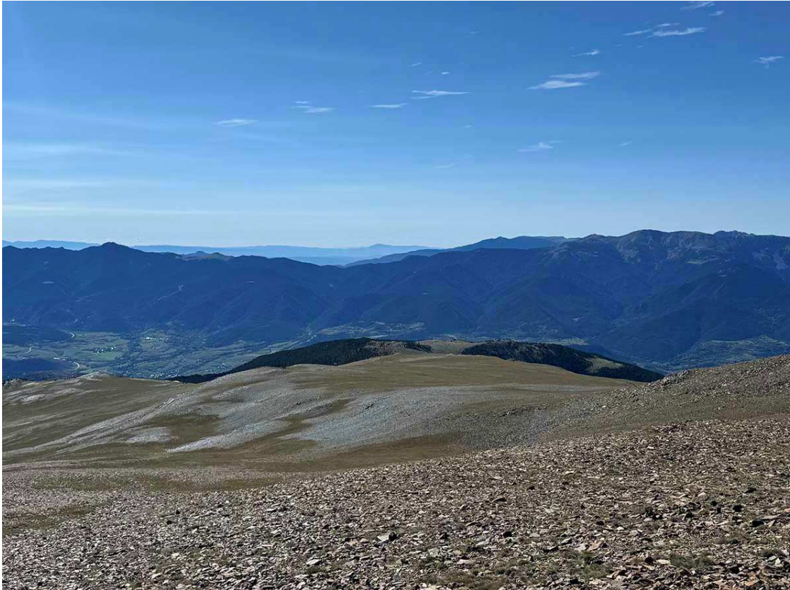
Llom sud de La Carbassa, una zona de prats de pendent suau on hi havia traçades pistes blaves en el projecte de l'estació d'esquí.

El cim de la Carbassa és planer i hi trobem un punt geodèsic de formigó i un abrigo de pedra en forma de semicercle coronat per un amuntegament de pedres, on, per cert, viu una musaranya ben grassoneta i confiada que no tarda gaire a apropar-se a la motxilla per intentar trobar alguna cosa de menjar. Cal recordar que el Pic de la Carbassa forma part del llistat dels 100 cims de la FEEC.