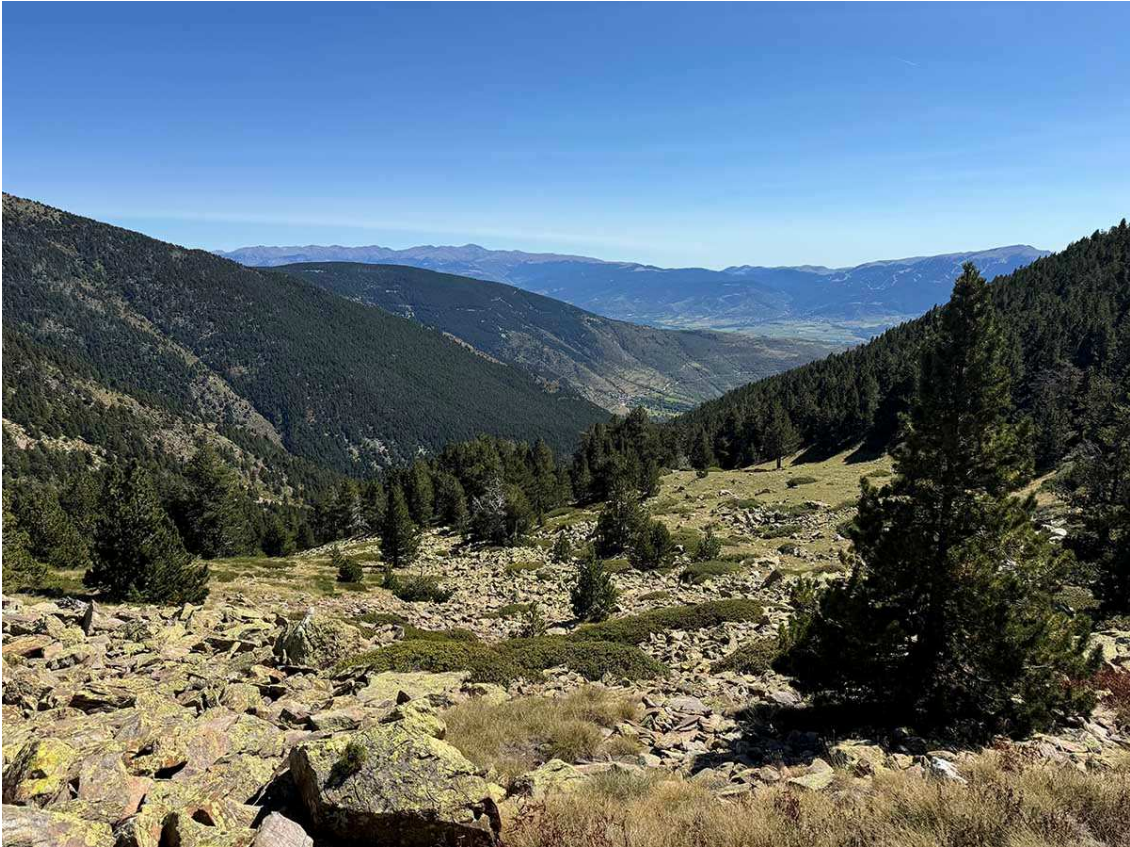
Entrant al bosc del Clot del Torer.