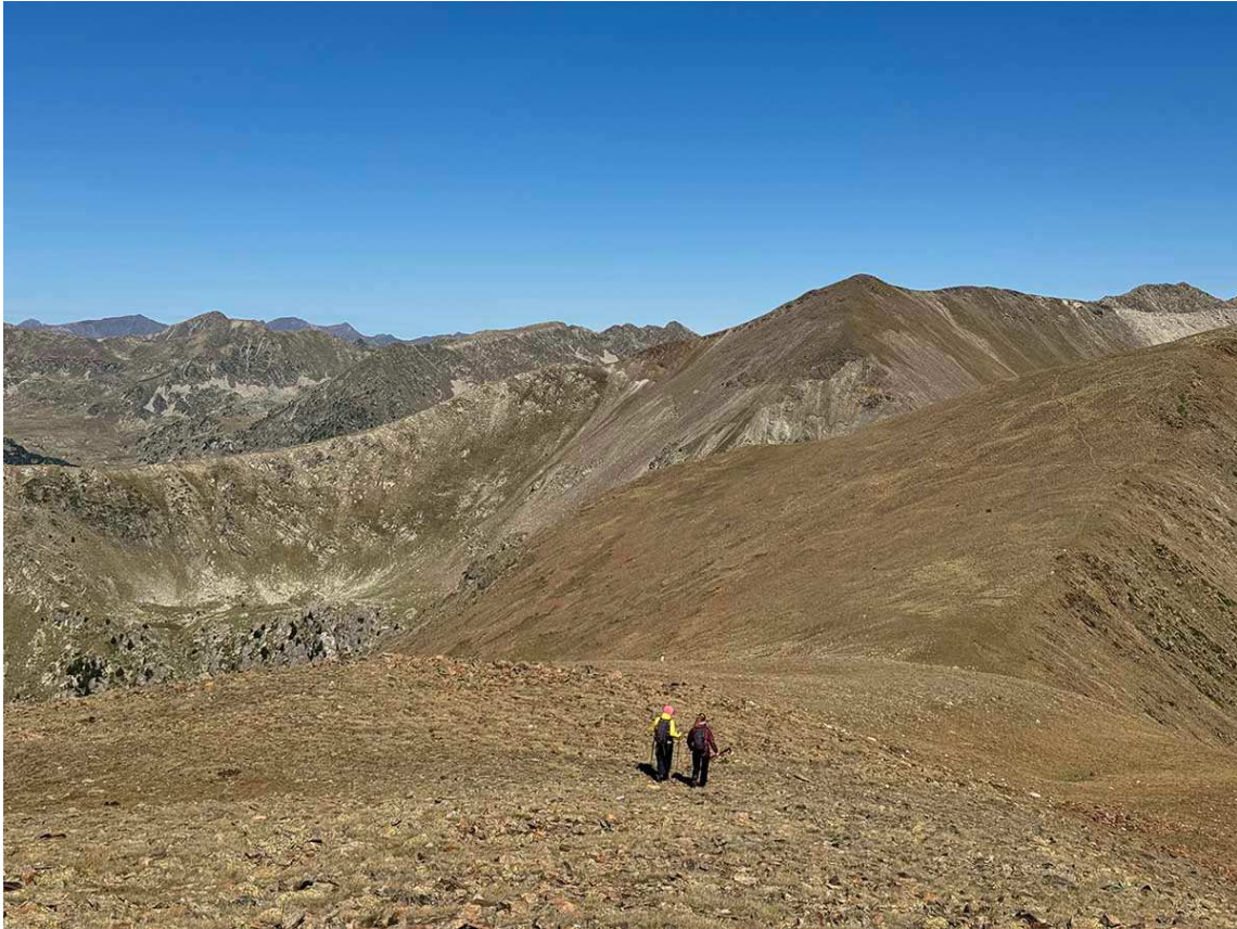
Baixant cap a la Portella del Torer, des del cim de La Carbassa nord.

Arribats a la Portella, iniciem un descens molt pronunciat cap a l'est. La baixada és de gran pendent i sense corriol a la vista, per tant, cal seguir el track per no extraviar-se. L'alternativa fàcil, més segura, però també més avorrida, és fer el camí de tornada pel mateix lloc per on hem pujat.