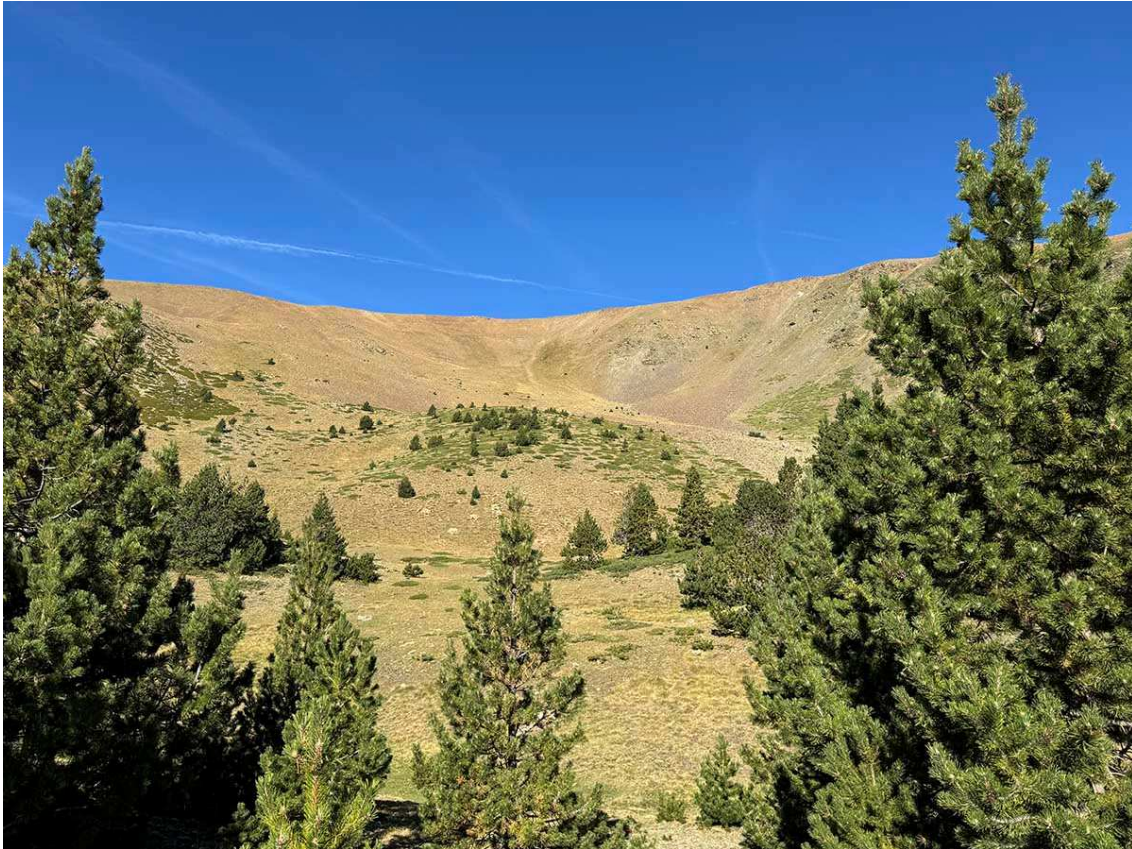
Olla de La Carbassa, al vessant sud-est del cim.

Passem pel refugi lliure de Font Berenella, a 2.060 metres, en un espai més obert de bosc. Seguim per la clariana amunt fins a arribar a la cabana de pedra (2.150 m) i, a partir d'aquest punt, tornem a travessar un bosc espès de pi negre, amb el sender ja poc fressat, fins a arribar a un petit planell que fa de límit de bosc i d'inici de zona totalment coberta de prat alpí. Ja podem veure l'olla del vessant est de la Carbassa.