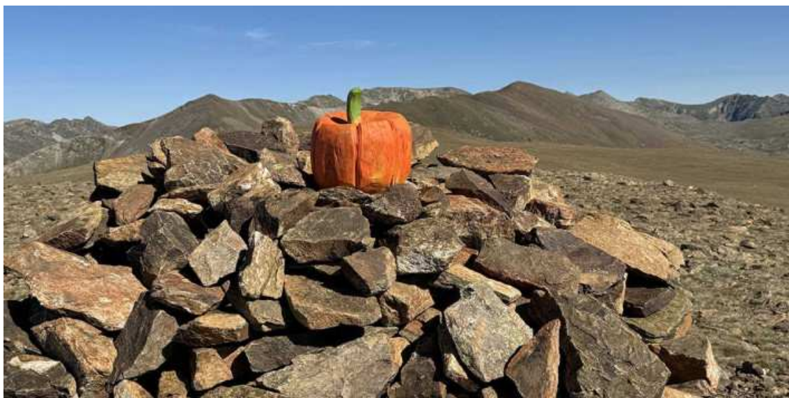
Dues carbasses ens donen la benvinguda al cim mateix

En total, 9,2 km i 1.005 metres de desnivell positiu pujant per Font Berenella i tornada per Portella del Torer