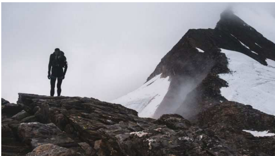
Kilian Jornet en Alpine Connections.

Kilian Jornet avanza en su desafío alpino 'Alpine Connections', conquistando 18 cumbres en un solo día durante el Spaghetti Tour en Valais. Con 41 cuatromiles ya alcanzados en solo nueve días, Kilian sigue rompiendo límites en la alta montaña.