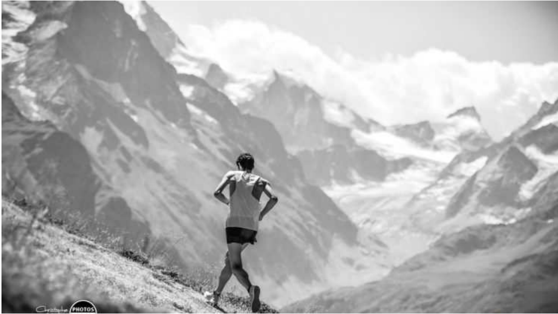
Kilian Jornet en Sierre-Zinal

51 º ediciones para la carrera Suiza, la carrera por montaña más rápida posiblemente en todo el mundo. Sus 2200+ y 31 kilómetros de distancia , hacen soñar a toda la elite por rebajar las 2:30 en chicos y las 3:00 entre las chicas. Un terreno no especialmente difícil, salvo contados metros en el recorrido.