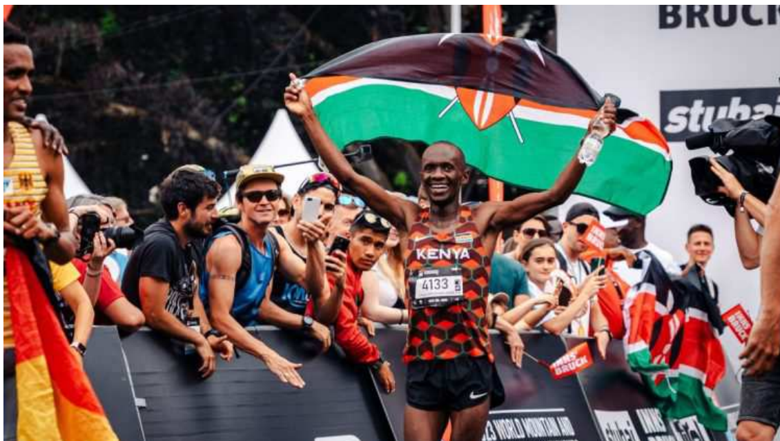
Kiriago defendera el título obtenido en 2023

Remi Bonnet: aunque parece que esta carrera se le resiste al suizo, es una de sus carreras donde «peor» rendimiento ha obtenido históricamente. Tiene un tercer lugar en el año 2020.