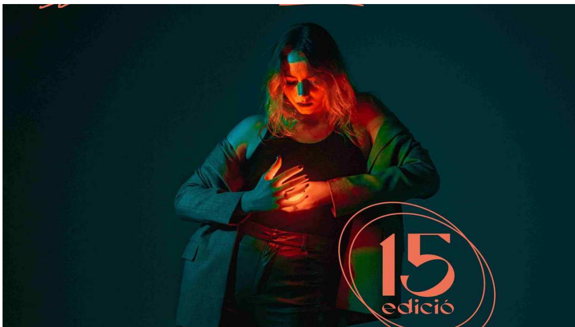
photo_camera Cartell del 15è Cerdanya Film Festival

El certamen se celebra de l'1 a l'11 d'agost i, com a novetat, enguany estrena una mostra d'arts visuals de carrer