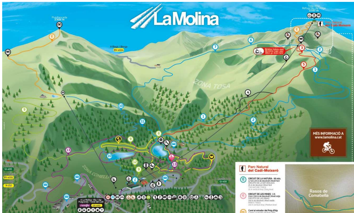
Mapa de La Molina en verano con el Refugio del Niu de L'Àliga arriba a la derecha del plano

El Niu de l'Àliga es un refugio de montaña situado a 2.537 m de altitud. Ubicado en la cima de la Tosa de Alp, dentro del término entre los municipios de Bagà y Berguedà y en el parque natural Cadí-Moixeró. Ademàs se trata del refugio guardado más alto del Pirineo.