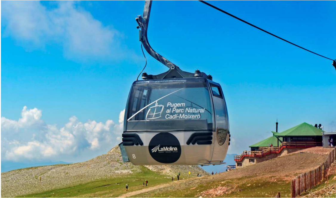
El telecabina de acceso al Niu de l'Àliga.