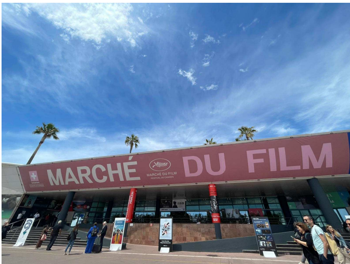
El Cerdanya Film Festival, present al Marché du Film del Festival de Cinema de Cannes / @recercacerdanya

També s'ha ampliat enormement la xarxa de contactes que, a mitjà termini, es convertiran en convenis de col·laboració per tal de promoure projectes comuns d'exhibició, foment del talent i foment de la indústria a la nostra regió.