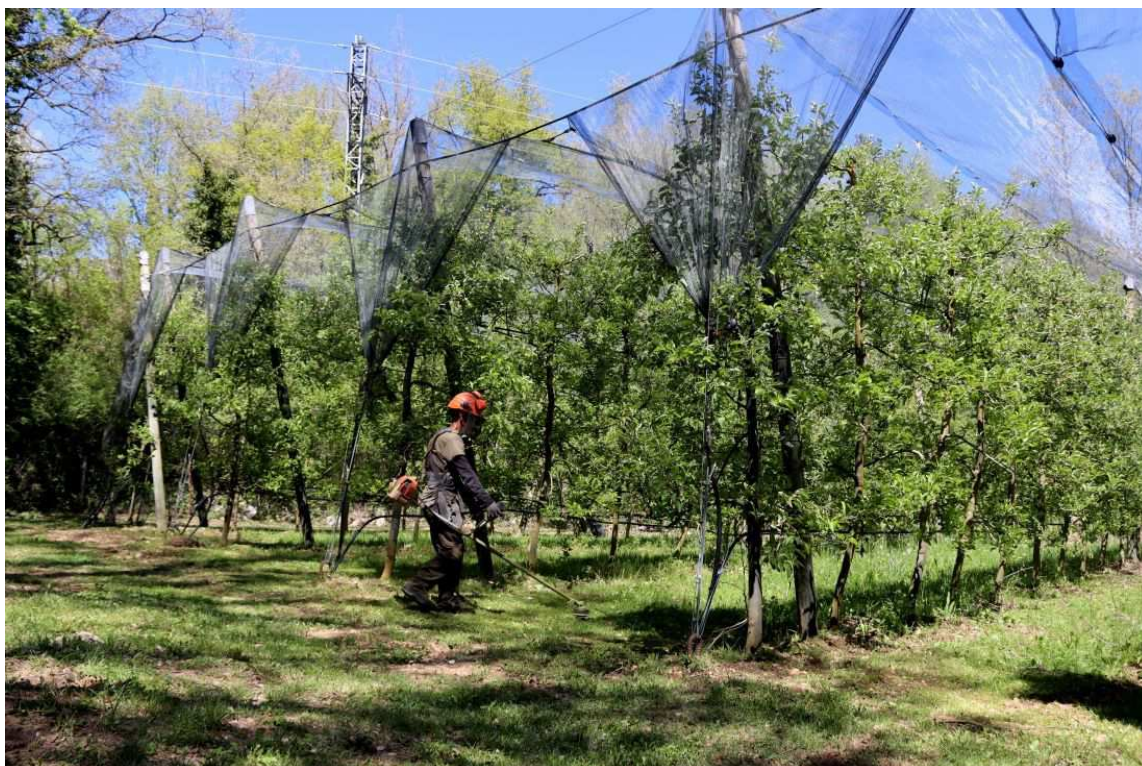
Els productors de poma de muntanya del Pirineu i Prepirineu s'enfronten a la pitjor collita de la seva història.

Per lluitar contra episodis de glaçades com el d'aquest any, Pintó explica que la millor solució és implantar un sistema de reg per aspersió. El problema, diu, és que es necessita molt cabal d'aigua, 40 litres per hectàrea i segon, i, a més, és car. Un sistema que, a més, té la seva complexitat ja que, segons diu, no poden passar més de 40 segons a caure aigua sobre la poma. Tot plegat, fa que molts dels productors no puguin permetre's implantar-lo.